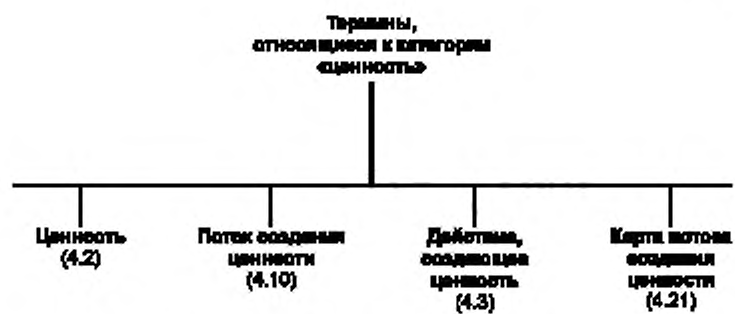
Рисунок А.4 — Термины, относящиеся к категории «ценность»