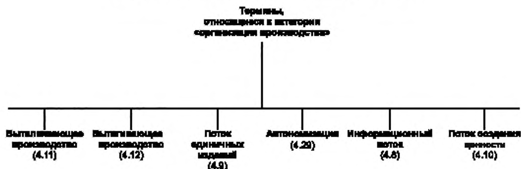
Рисунок А.1 — Термины, относящиеся к категории «организация производства»