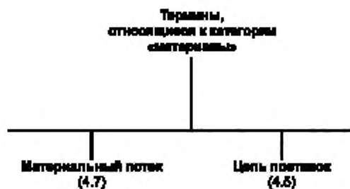
Рисунок А.3 — Термины, относящиеся к категории «материалы»